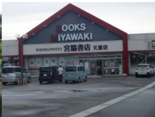
※乱川駅を通り過ぎて進行！！押切川と宮脇書店